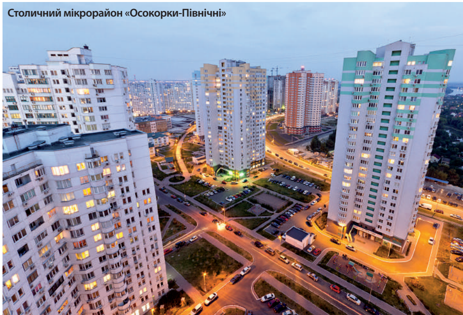
Столичний мікрорайон «Осокорки-Північні»