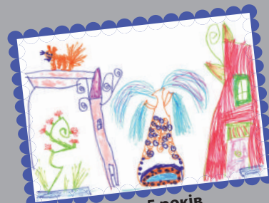
Рапп Маруся, 5 років (Завод ЗБК ім. Світлани Ковальської)