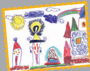
Рапп Маруся, 5 років (Завод ЗБК ім. Світлани Ковальської)