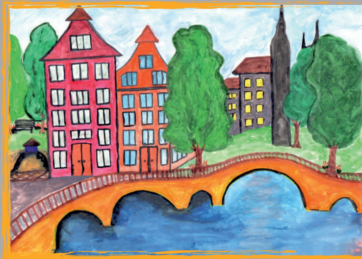
Переможниця конкурсу – Кантур Ліля, 5 років, Завод ЗБК ім. Світлани Ковальської