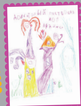
Рапп Маруся, 5 років (Завод ЗБК ім. Світлани Ковальської)