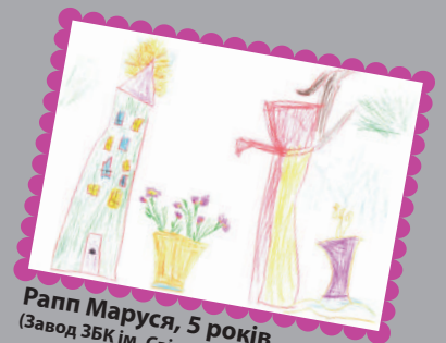
Рапп Маруся, 5 років (Завод ЗБК ім. Світлани Ковальської)