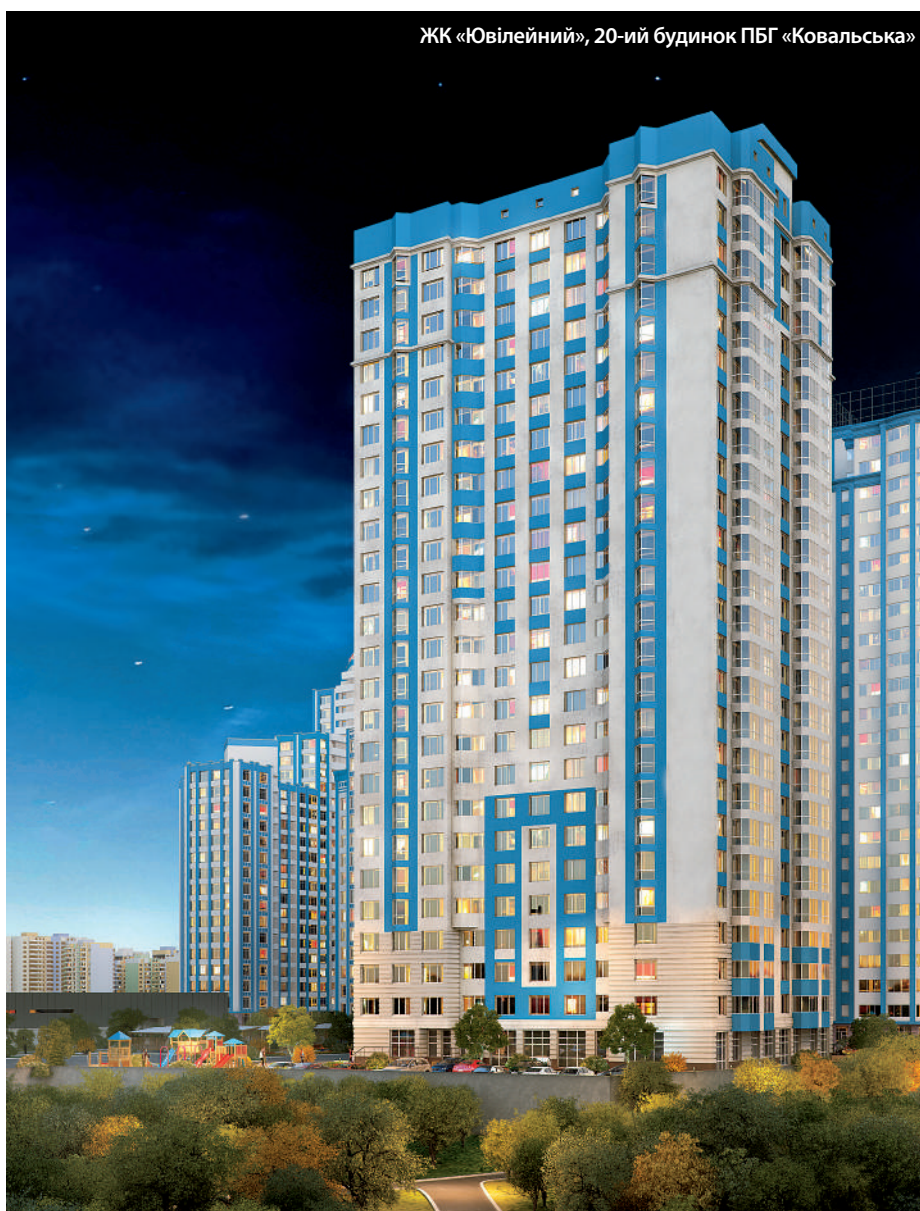
ЖК «Ювілейний», 20-ий будинок ПБГ «Ковальська»

Актуальність будівельної професії – поза часом. Протягом всього життя ми щось будуємо – плани, своє майбутнє, стосунки, власне щастя... Творчість і будівництво – слова-синоніми, проте, на відміну від людей інших професій, будівельники по крупицях створюють наше оточення. Серед них – фахівці Будівельного комплексу Промислово-будівельної групи «Ковальська», які вже десяток років невпинно зводять житлові будинки, офіси, стадіони, роблячи наше життя легшим, зручнішим і цікавішим.