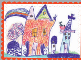
Рапп Маруся, 5 років (Завод ЗБК ім. Світлани Ковальської)