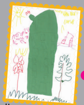
Цапар Валерія, 4 роки (центральный офіс ПБГ «Ковальська»)