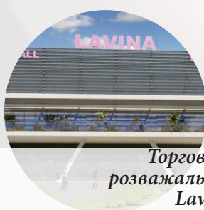
Торговельно-розважальний центр Lavina