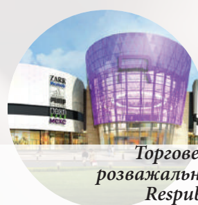
Торговельно-розважальний центр Respublika