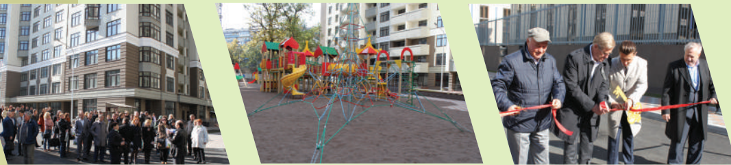
Урочисте відкриття ЖК «Зелений острів-2»