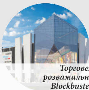
Торговельно-розважальний центр Blockbuster MALL

За 2014 рік з «Бетону від Ковальської» зведено та продовжують будуватися такі об'єкти: