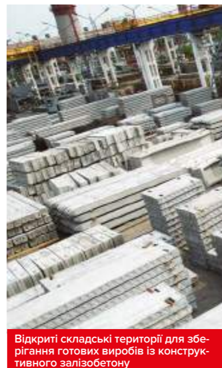
Відкриті складські території для зберігання готових виробів із конструктивного залізобетону

Купується та впроваджується обладнання ELBA для виробництва бетонних сумішей, обладнано сучасну контрольну лабораторію. Головним акціонером ВАТ «Завод залізобетонних виробів №5» стає ВАТ «Завод ЗБК ім. Світлани Ковальської».