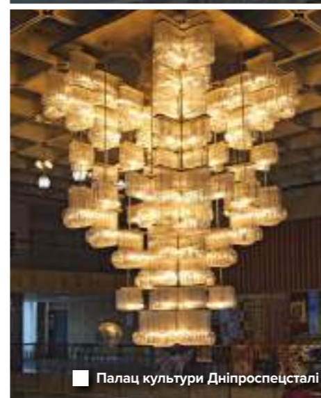
Палац культури Дніпроспецстали