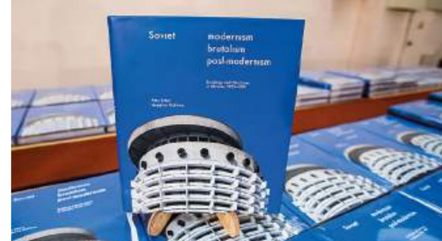
Обкладинку книги прикрашає фото готелю «Салют», який є яскравим прикладом архітектури бруталізму. Йому вдалося уникнути загрози руйнування, і це влучно ілюструє долю радянської споруди в сучасній Україні