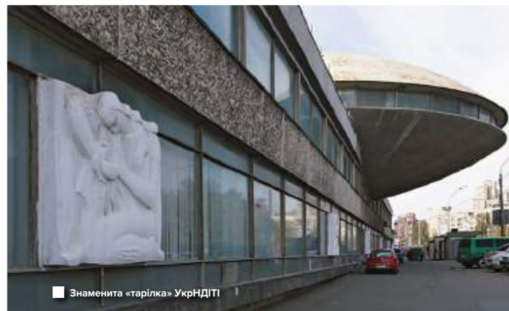
Знаменита «тарілка» УкрНДІТІ

Фахівцям книга здається якісним зачаткуванням дослідження теми українського урбанізму, що потребує уваги. Позаяк залишилося ще багато впізнаваних об'єктів радянського модернізму, які не увійшли до книги. Є навіть цілі міста, побудовані певним стилем, цінність яких українцям слід усвідомити.