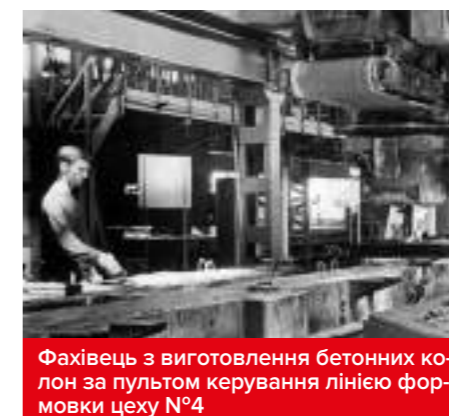
Фахівець з виготовлення бетонних колон за пультом керування лінією формування цеху №4

За участю представників компанії Nordimpianti відбувся запуск нової технологічної лінії «Екструдер». Довова потужність п'яти доріжок лінії – понад 500 погонних метрів багатопорожнинних плит перекриття, довжина яких може становити від 4 м до 20 м, товщина – 220-500 мм. На базі підприємства з'являється науковий Інноваційно-технологічний центр – єдиний в Україні випробувальний комплекс з дослідження існуєючих і винайдення нових рецептур для виготовлення будівельних матеріалів.