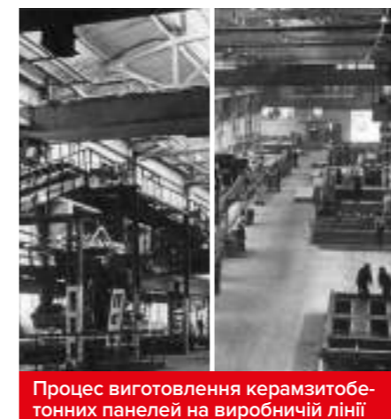
Процес виготовлення керамзитобетонних панелей на виробничій лінії

Завод перетворюється на ТОВ «Бетон Комплекс», отримує сертифікати ISO 9001:2000 та №UA2.002.01425. Вводиться в дію потужна автоматизована лінія з виробництва фігурних елементів мостіння ТМ «Авеню» на обладнанні німецької фірми HESS. Цілковито освоєно виробництво збірних залізобетонних конструкцій для споруд каркасного типу. Вводиться в дію друга повністю автоматична лінія з виробництва фігурних елементів мостіння.