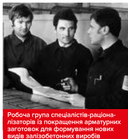
Робоча група спеціалістів-раціоналізаторів із покращення арматурних заготовок для формування нових видів залізобетонних виробів