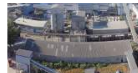
Перша лінія з виробництва фігурних елементів

Відкривається друга лінія з виготовлення багатопорожнинних плит перекриття шириною від 550 мм до 1350 мм, оснащена автоматизованою машиною Nordimpianti, яка потребує мінімального втручання оператора. Придбано власний вагонний парк: 360 сучасних вагонів ємністю до 71 т кожний почали доставляти сировину з кар'єрів групи на підприємства.