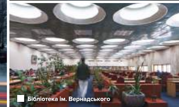
Бібліотека ім. Вернадського