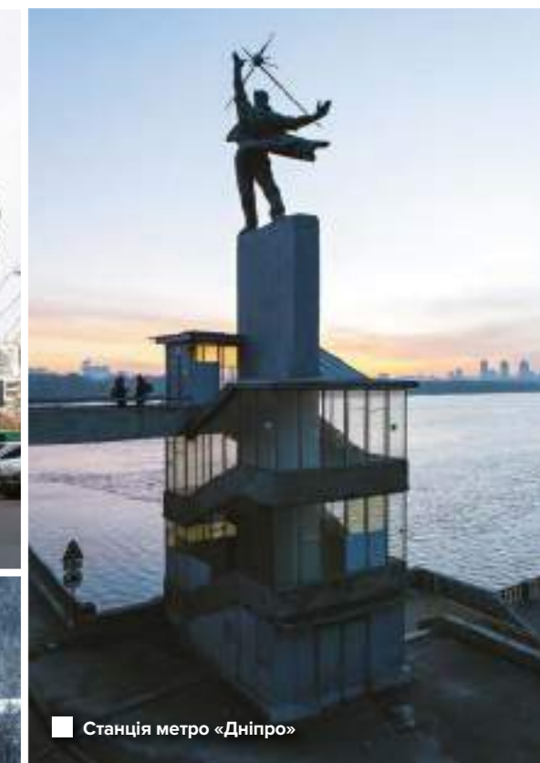
Станція метро «Дніпро»